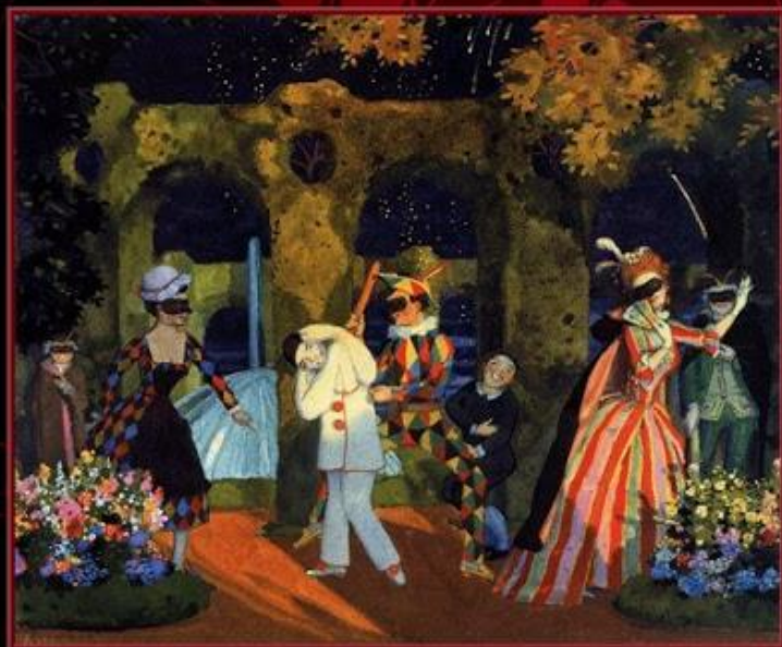
Роберт Шуман. Карнавал

В нём пёстрой вереницей проходят сценки, танцы, маски, персонажи (Пьеро и Арлекин), женские образы (среди них Киарина — Клара Вик), музыкальные портреты Паганини, Шопена.