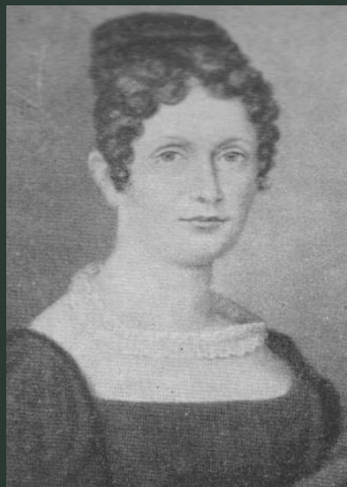
Иоганна Христиана Шуман

Родился 8 июня 1810 года в Цвикау (Германия), в семье книготорговца и издателя.