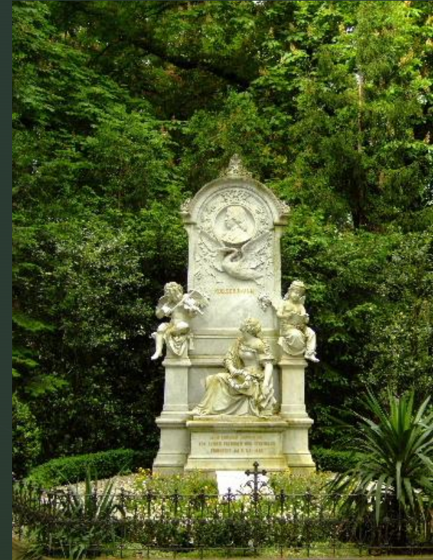
Могила Роберта и Клары Шуман

Существует музыкальная премия имени Роберта Шумана, учрежденная мэрией Цвиккау. Лауреатов премии чествуют, по традиции, в день рождения композитора - 8 июня. В их числе - музыканты, дирижеры и музыковеды, внесшие весомую лепту в популяризацию произведений композитора.