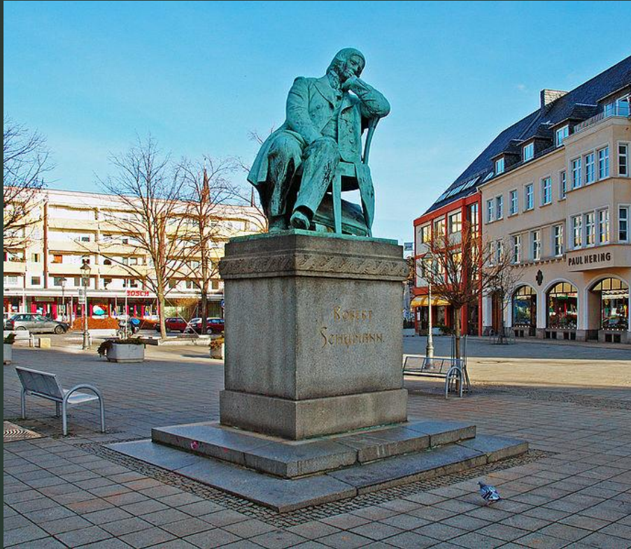
Памятник Р. Шуману в Цвиккау

Имя Шумана носит международный конкурс исполнителей академической музыки, который так и называется - Internationaler Robert-Schumann-Wettbewerb. Впервые он состоялся в 1956 году в Берлине.