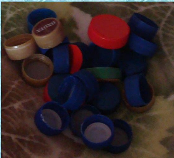
Пробки от бутылок