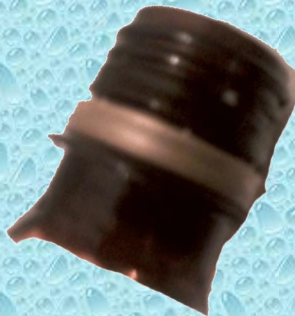
Горлышки от бутылок