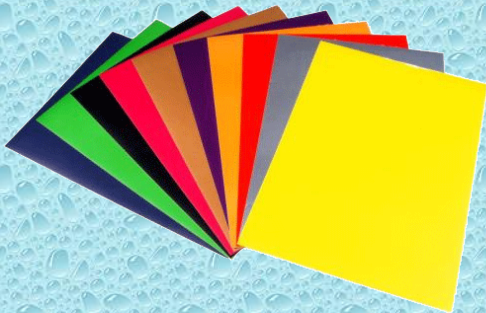
Цветная бумага (лучше самоклеющаяся)